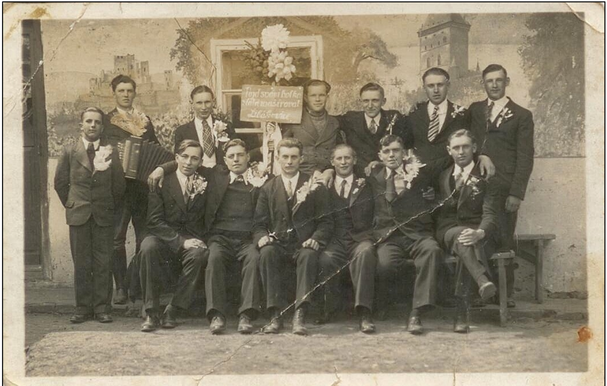
odvod branců v roce 1937