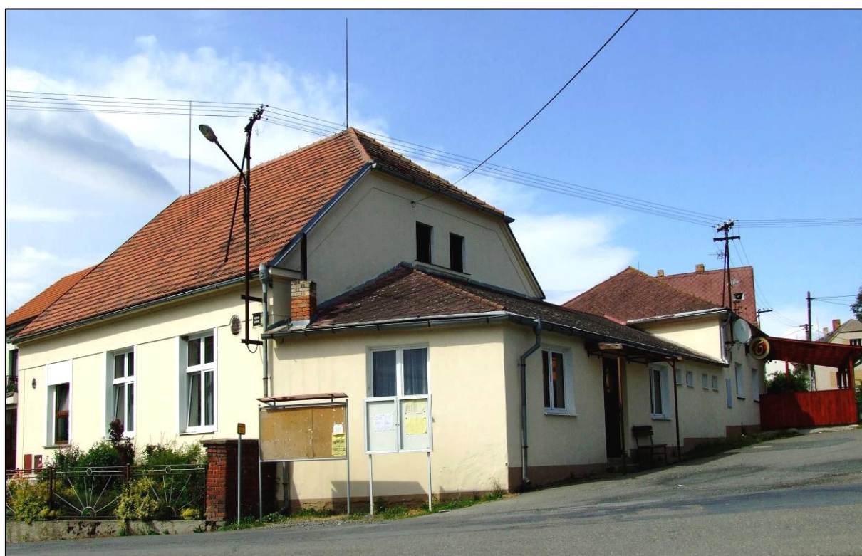
hostinec v Libákovcích v současné době