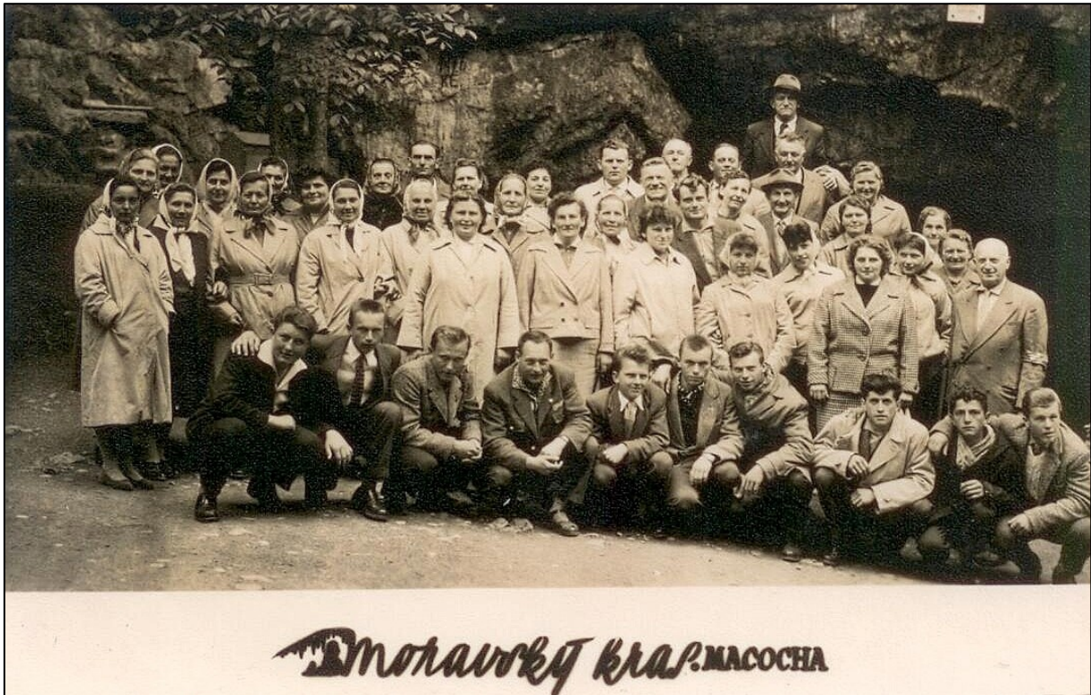
zájezd JZD do Moravského krasu