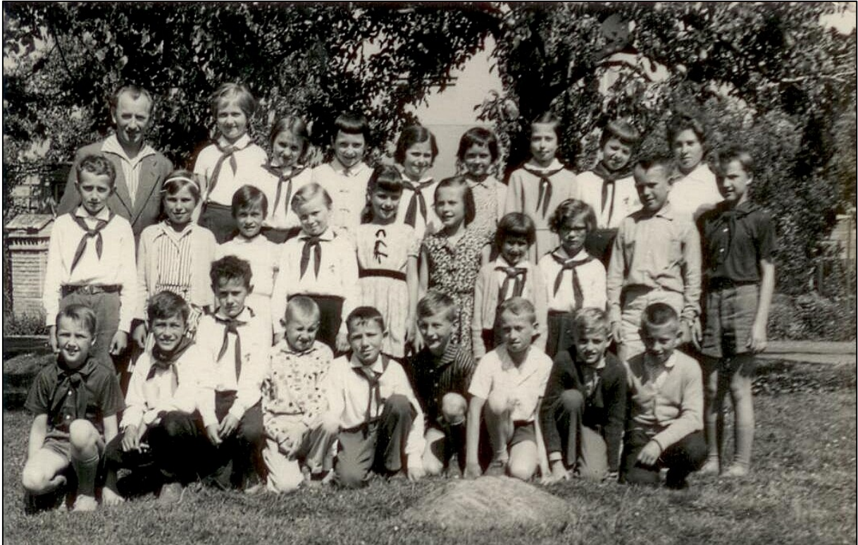
školní fotografie z Řenečské školy kolem roku 1965