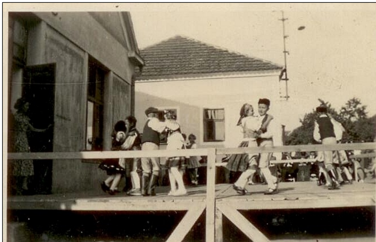
hostinec v Libákovcích– Staročeské máje