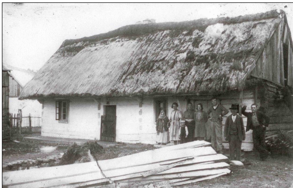
roubenka č. p. 33 „U MOČÍTKŮ“