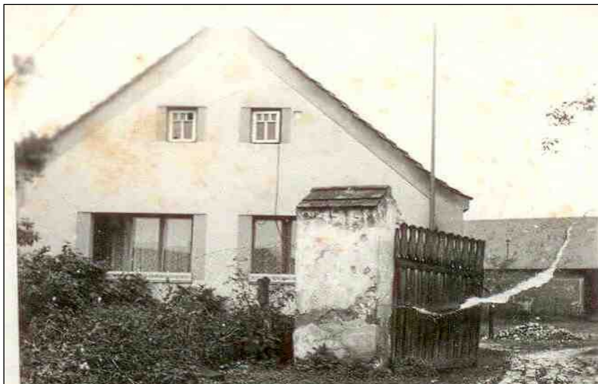
č. p. 27 „U KOLENŮ“