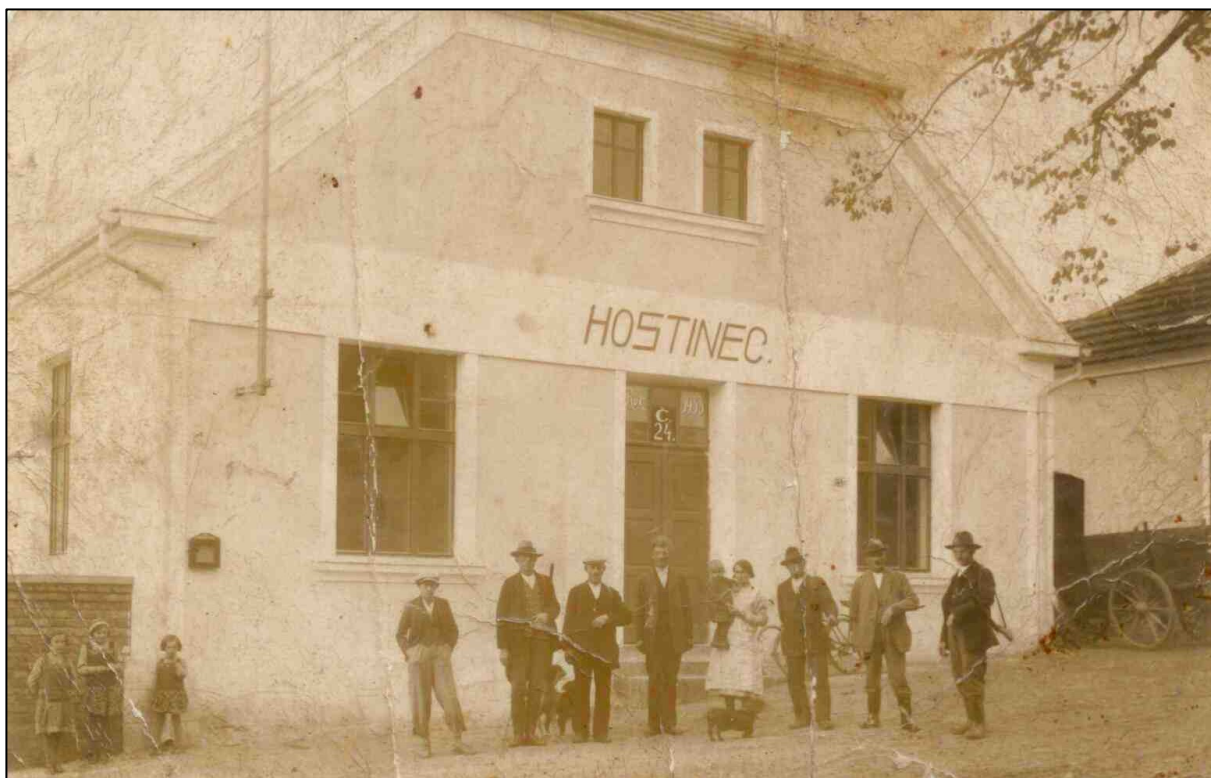
hostinec č. p. 24