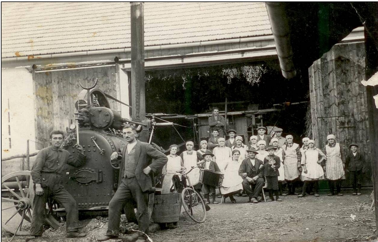
sklizeň obilí v č. p. 13 „U CHÁRŮ“