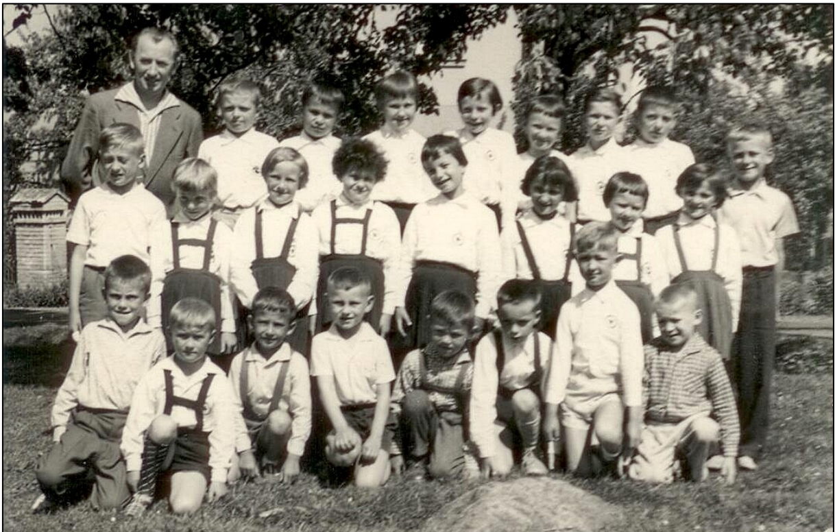
školní fotografie z Řenečské školy kolem roku 1965