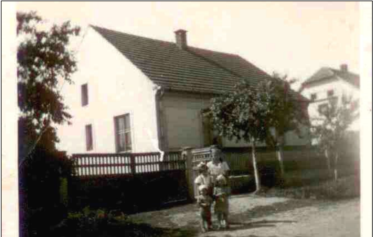
č. p. 47 „U GAJERŮ“ v roce 1950