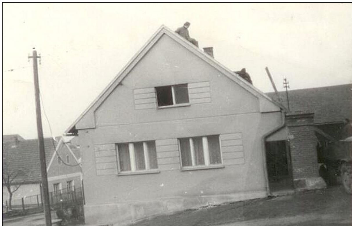
č. p. 56 „U STRNADŮ“