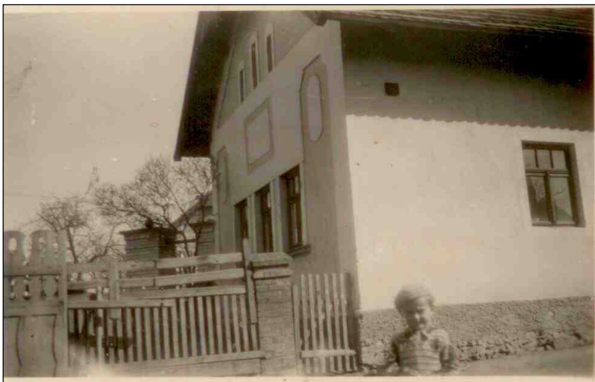
č. p. 25 „U PAVLÍČKŮ“