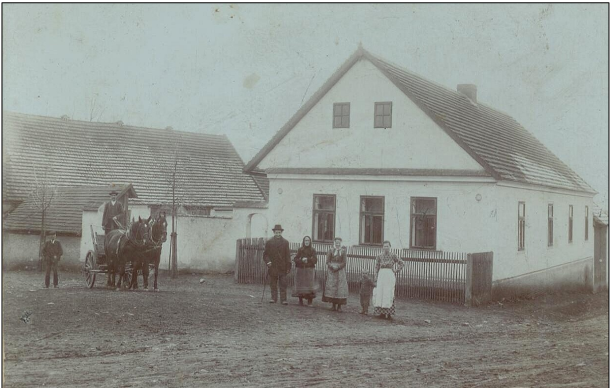
č. p. 3 „U KADLŮ“