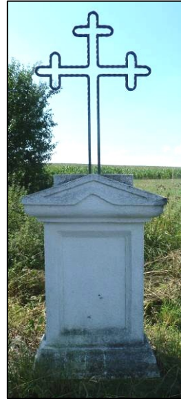
U „Samcojc“ křížku