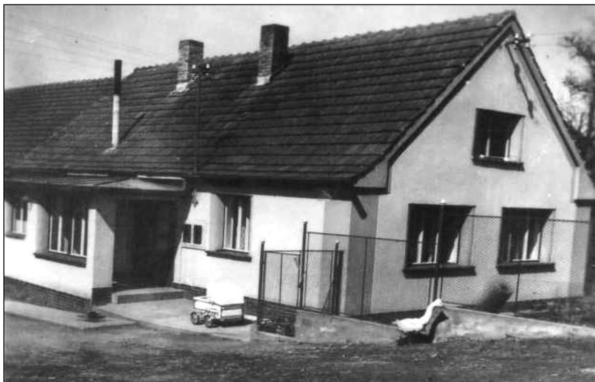
č. p. 12 „U PŘIBÁŇŮ“