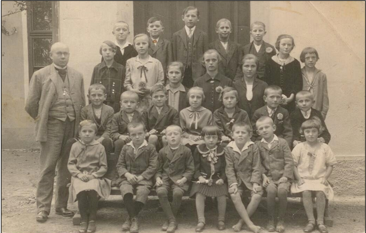
školní fotografie z roku 1930