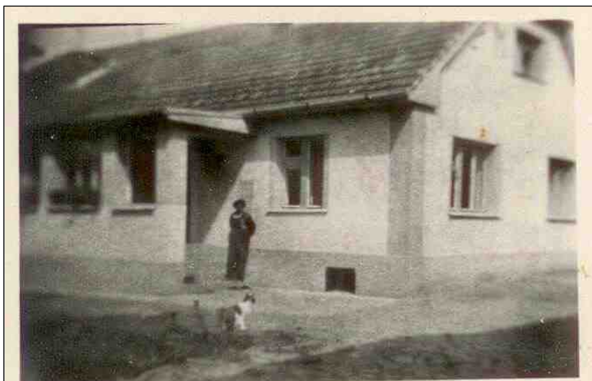
č. p. 41 „U DAVIDŮ“