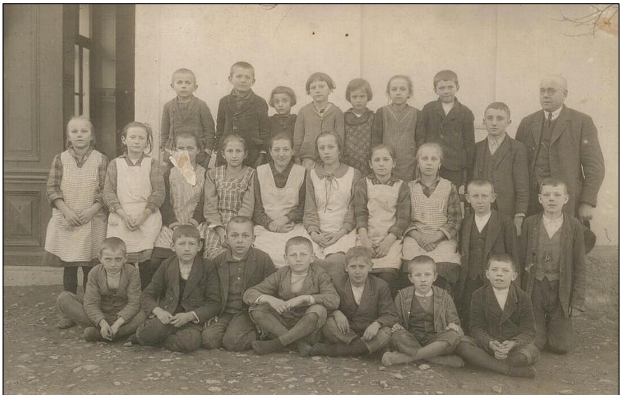
školní fotografie z roku 1928