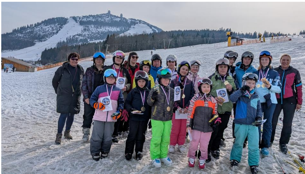
Účastníci lyžařského kurzu