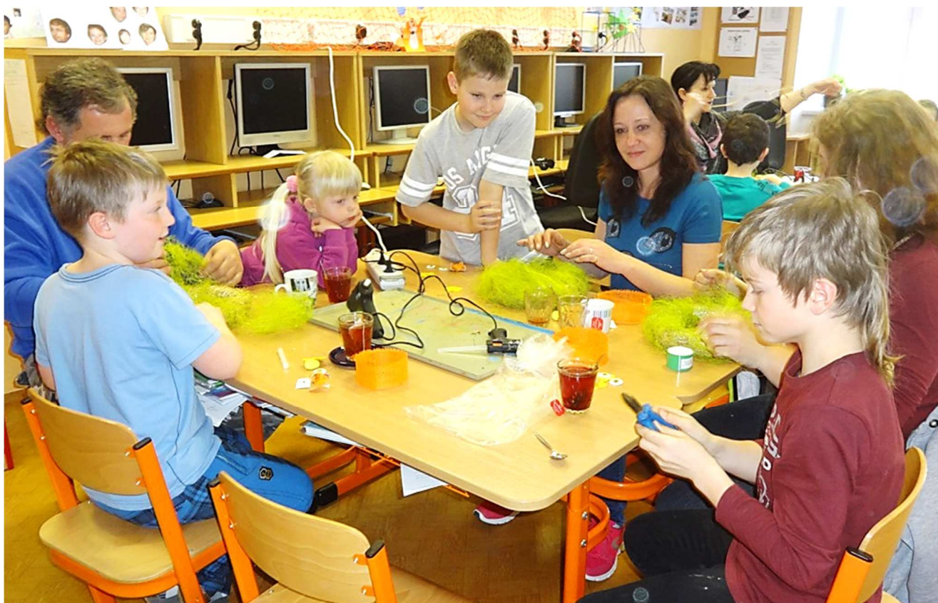
fotografie ze školní dílny s rodiči „...škola je pro spolupráci stvořená...“

ZPRAVODAJ - vydává Obec Řenče, Řenče 54, 334 01 Přeštice, IČ 00257184.