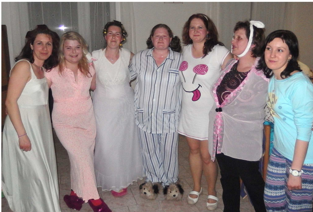
fotografie z 1. pyžamového bálu na Hájích dne 28. 3. 2015