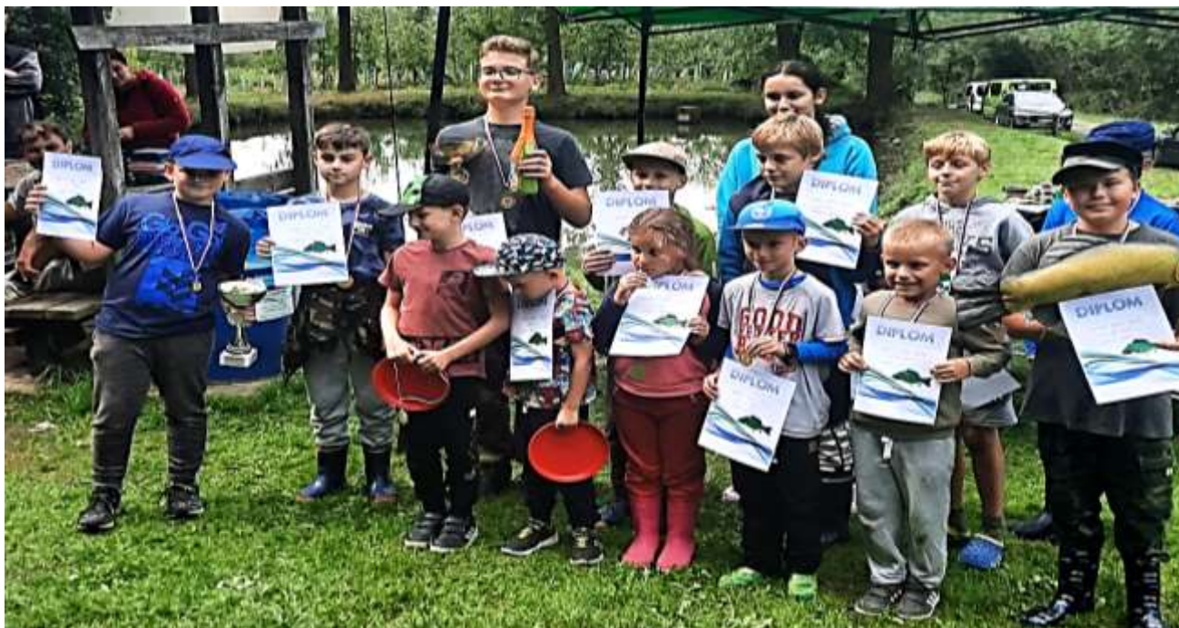
Účastníci rybářských závodů