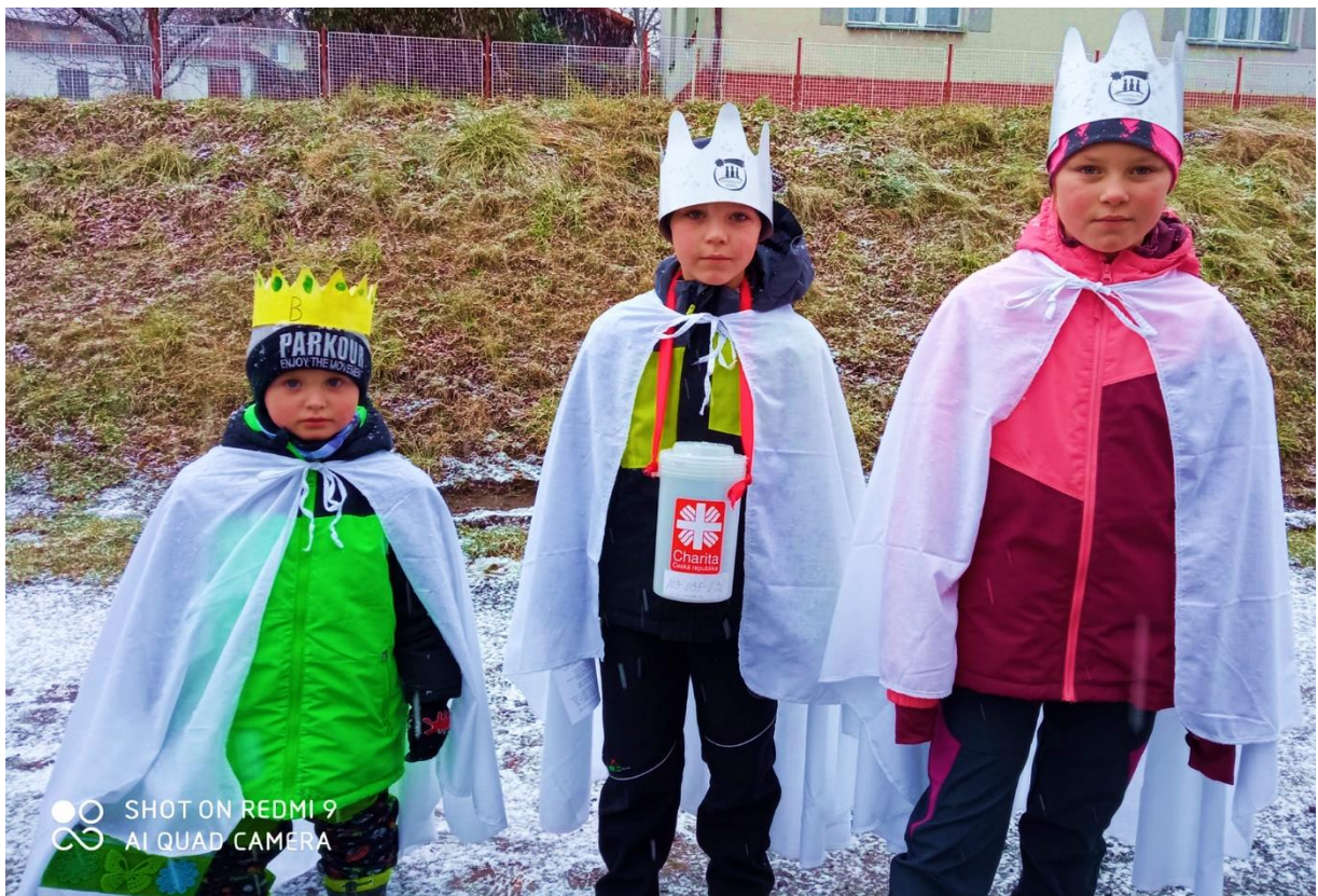
Tři králové v Řenčích