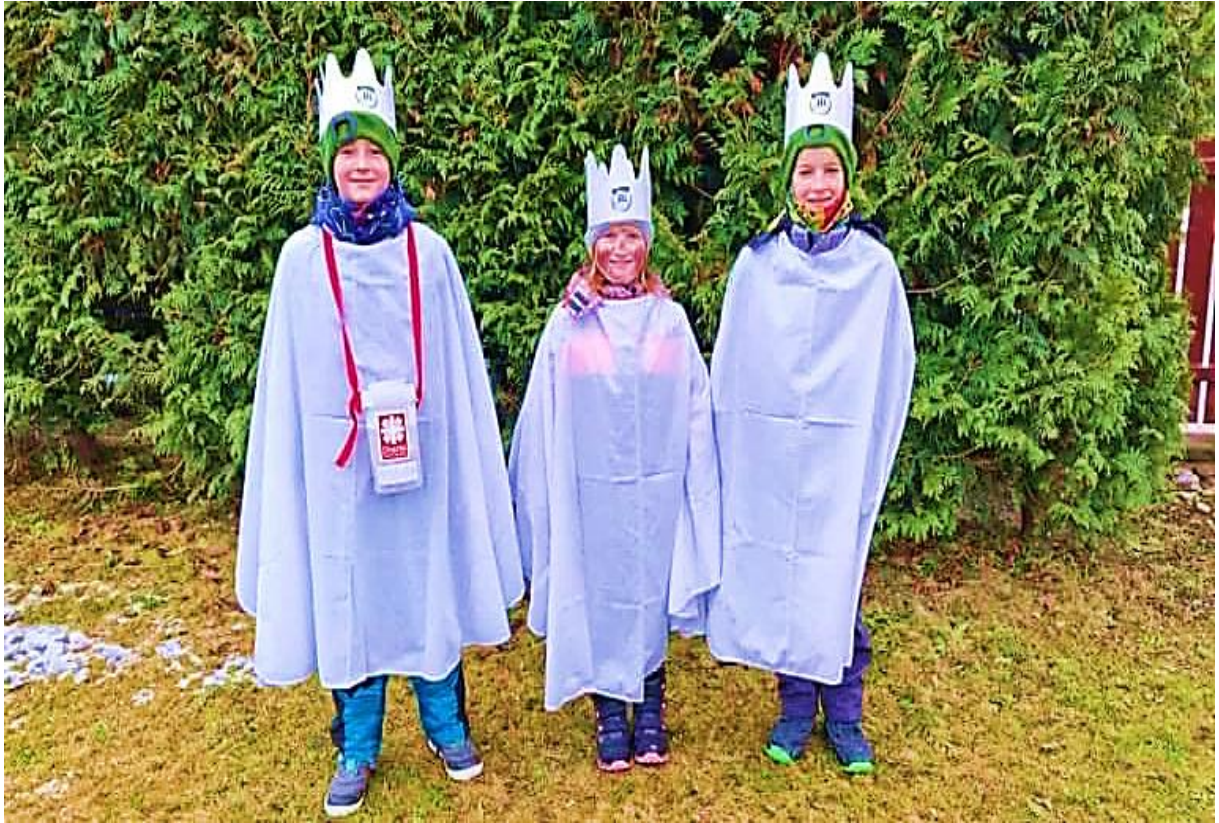
Tři králové na Hájích