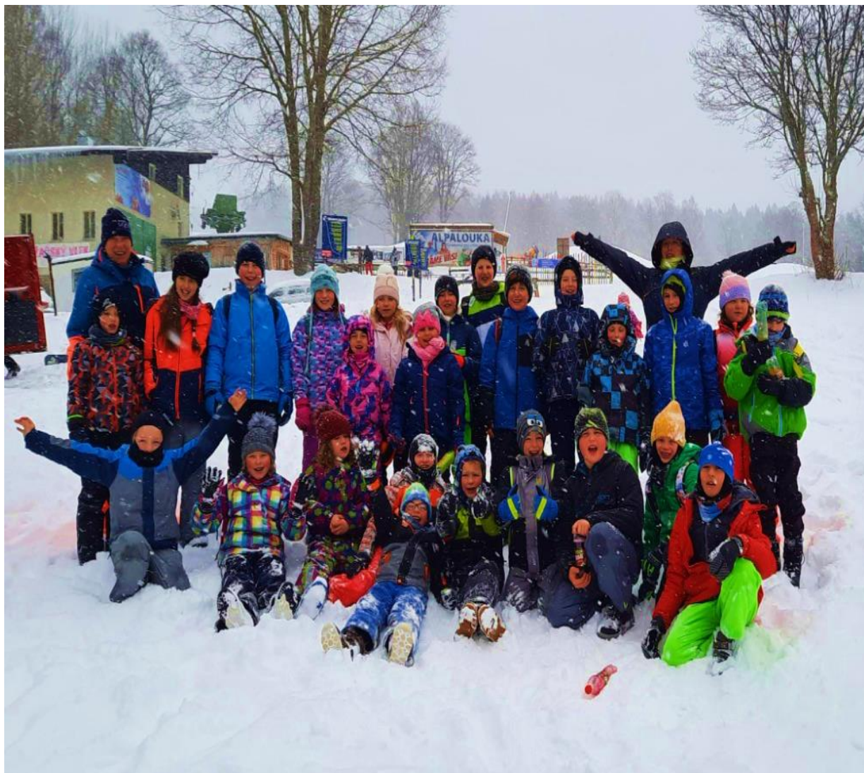
Účastníci školy v přírodě