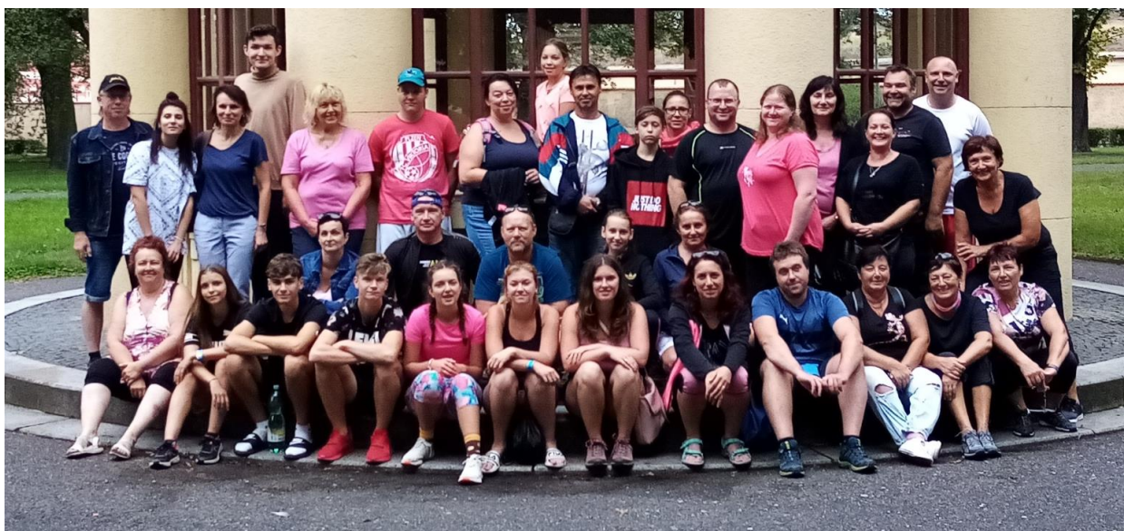
(společná fotografie z cyklistického zájezdu do Terezína)