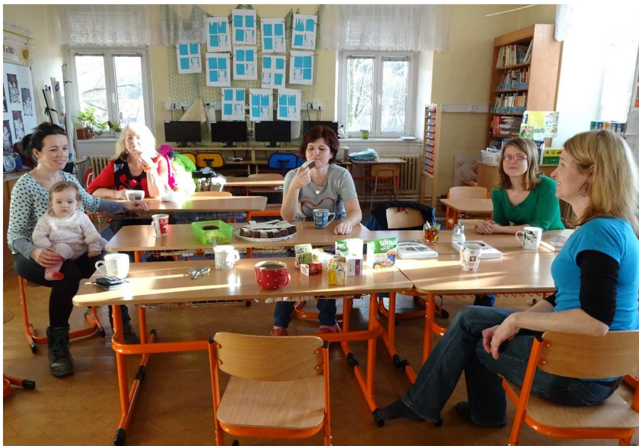
(fotografie ze setkání dne 10. 2. 2016)