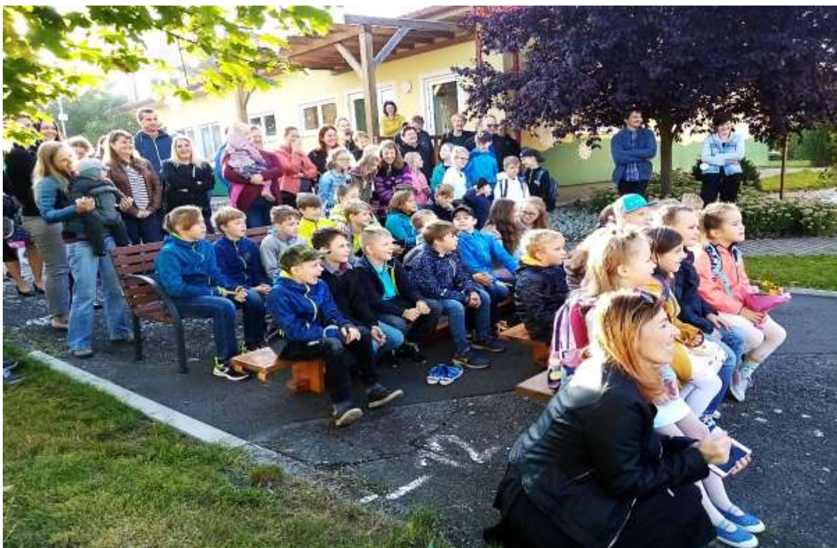
fotografie ze zahájení školního roku

Ještě před novým školním rokem ožila školka dětským křikem a radostí.