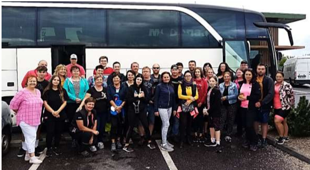
společná fotografie z cyklovýletu Milovice 2021