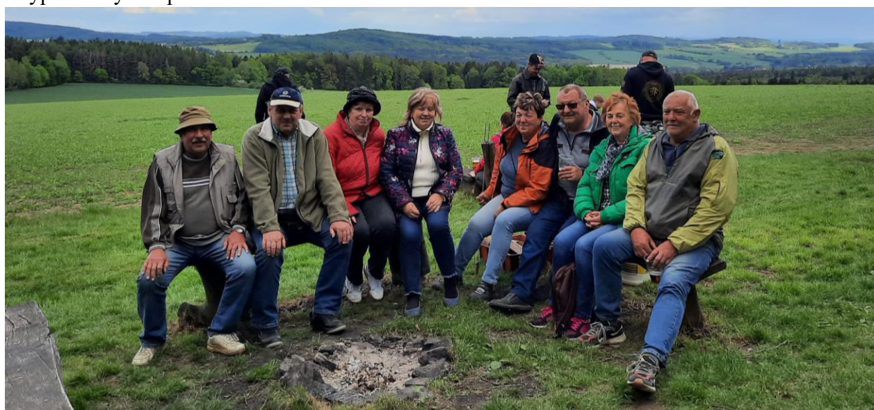
Závěrečná fotografie libákovických občanů.

Letošní výšlap na Kožich se vydařil. O hojně účast svědčí i to, že jsme snědli všechny buřty a vypili velký sud piva.