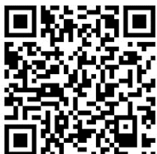
14ti denní (žlutá) 2 808 Kč

V případě nádoby o objemu 240l musíte částku zdvojnásobit.