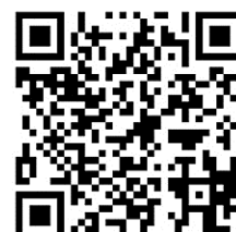
Kombinovaná (červená) 4 320 Kč

variabilní symbol: 2025 + místní část + číslo popisné (evidenční) (1 Řenče, 2 Libákovice, 3 Vodokrty, 4 Háje, 5 Osek, 6 Knihy, 7 Plevňov). Příklad pro Řenče s popisným číslem 54 bude V.S.: 2025154.