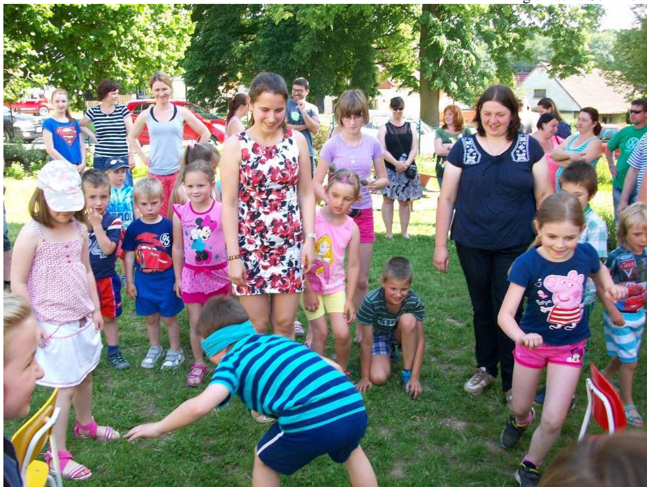
Fotografie z oslavy MDD dne 12. 6. 2015