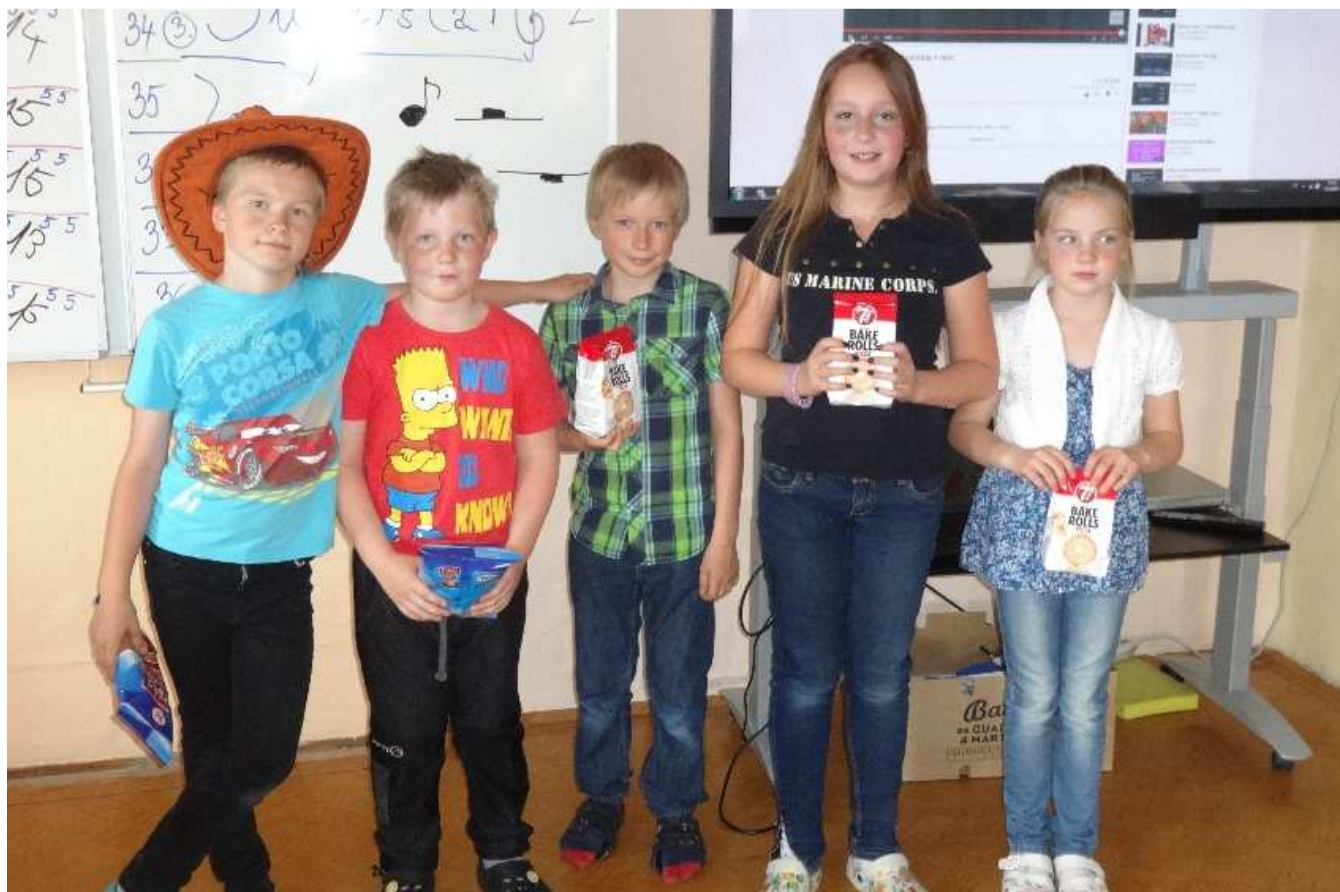
Fotografie ze soutěže Superstar

Není důležité vyhrát, nýbrž zúčastnit se a dobře se při tom bavit a to si myslím, že se zdárně podařilo. Děti z nižších ročníků a paní učitelky s paní školníkovou natěšeně usedly do publika a fandily všem soutěžícím. A na úplné zakončení soutěže jsme si společně všichni zatancovali.