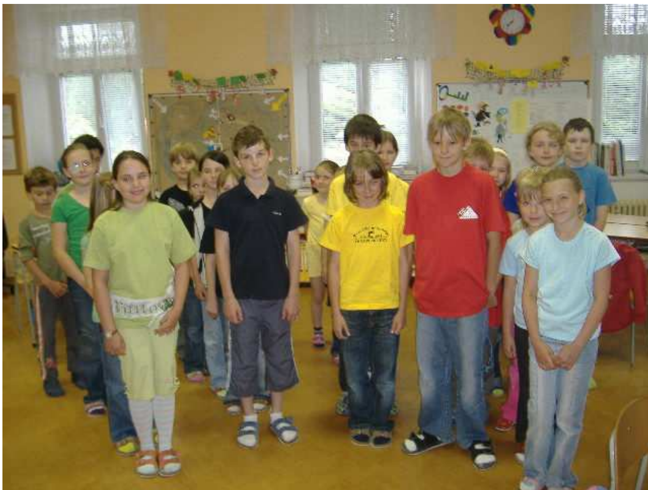
Žáci při plnění úkolů programu „Kupka plná otazníků“